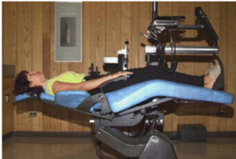
Figure 1. The correct position for an unconscious patient.